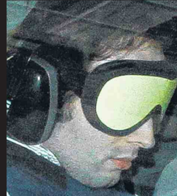
De ouders van Kim De Gelder verwijten de psychiater dat hij weigerde hun zoon te laten opnemen.